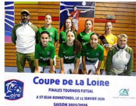
L'équipe U15 F. de l'ASSE.