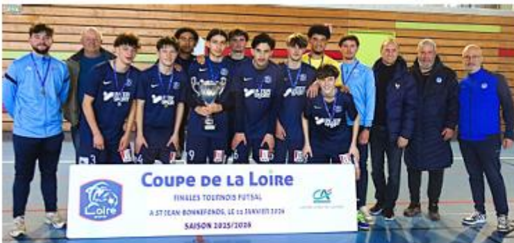
L'équipe U18 de Roannais Foot 42.