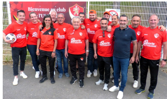
L'équipe dirigeante de l'U.S. VILLARS