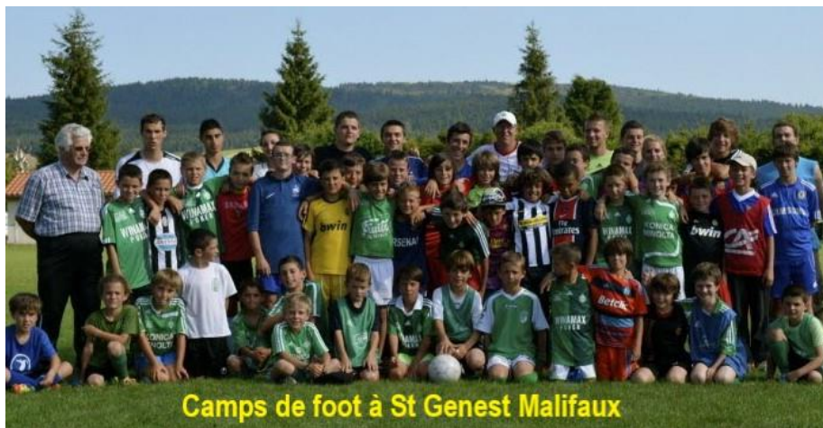
Camps de foot à St Genest Malifaux