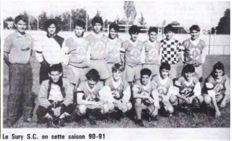
Le Sury S.C. en cette saison 90-91