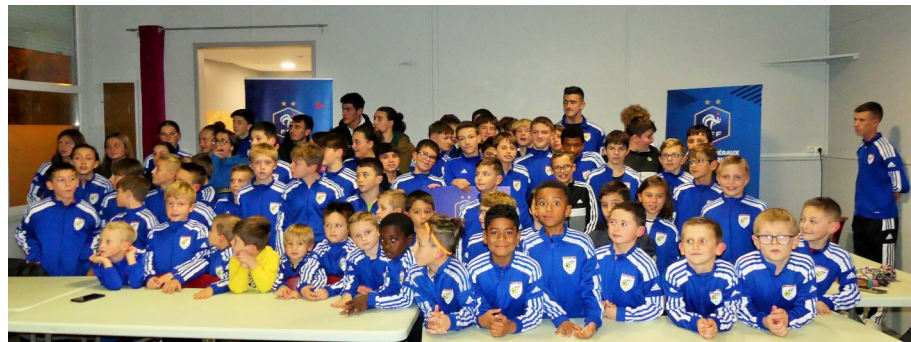
29/11/2024 : label Filerin