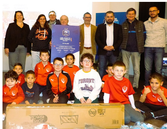
10/01/2025 : label Villars