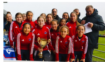
Coupe de La Loire FINALES 2026 FESTIVAL PITCH - U.13 G. - U.13 F. ANDRÉZIEUX-BOUTHÉON, LE 28 MARS 2026