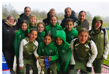
Coupe de La Loire FINALES 2026 FESTIVAL PITCH - U.13 G. - U.13 F. ANDRÉZIEUX-BOUTHÉON, LE 28 MARS 2026