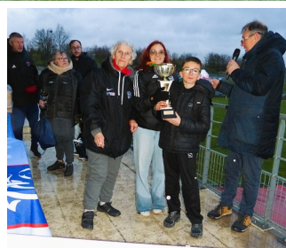
Coupe de La Loire FINALES 2026