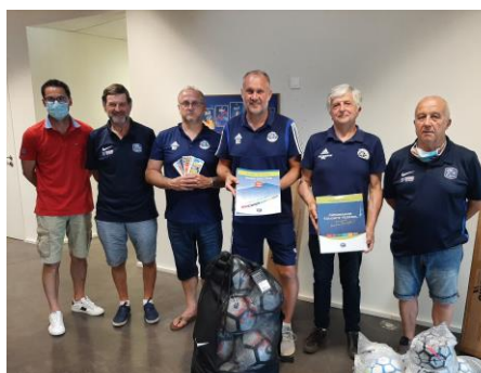
Sorbiers La Talaudière Foot